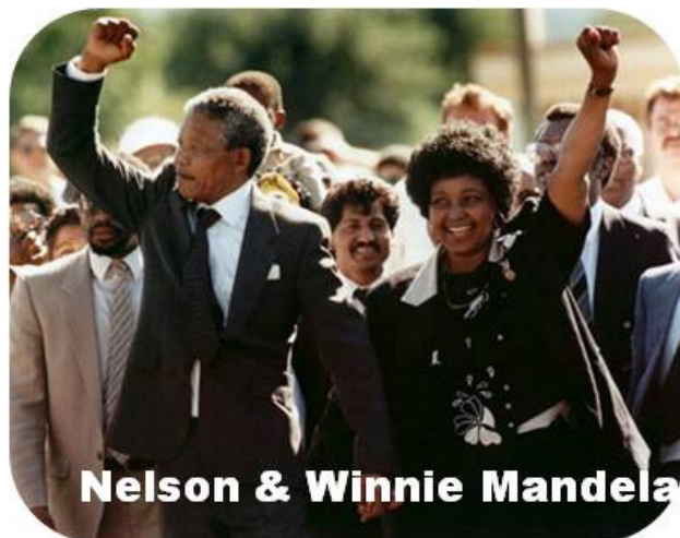
Nelson & Winnie Mandela

Rappelez-vous de cet adage selon lequel qui veut peut. Personne n'a dit que la tâche sera facile. Au contraire ! par exemple, Mandela est presque mort en prison et a souffert toutes sortes de tourments aussi bien publics que privés.