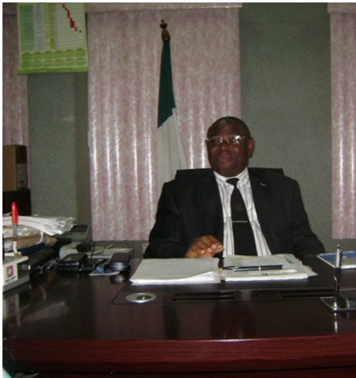
- Chief Judge of Kwara State (Nigeria)

Juge répondra à plusieurs de nos questions portant sur le thème des études de Droit en Afrique.