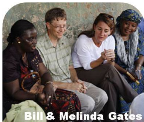
Bill & Melinda Gates

Qu'es-ce qui conduit les gens ordinaires à vaincre les obstacles liés à leur origine modeste et leur niveau social bas pour arriver au sommet de l'échelle contre toute attente ?