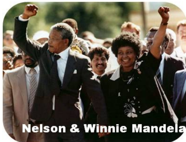
Nelson & Winnie Mandela

10 Funding opportunity for African students - Ferguson Scholarships